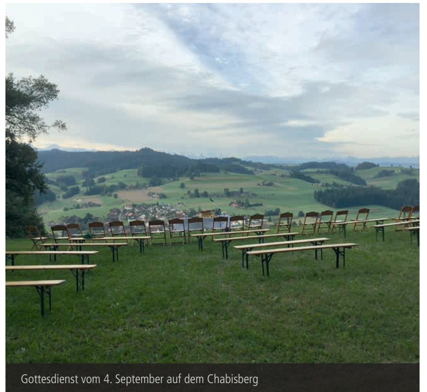
Gottesdienst vom 4. September auf dem Chabisberg